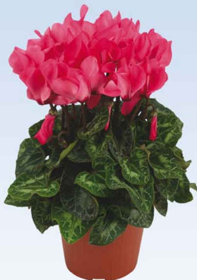
PREMIUM 'Saumon à Oeil'