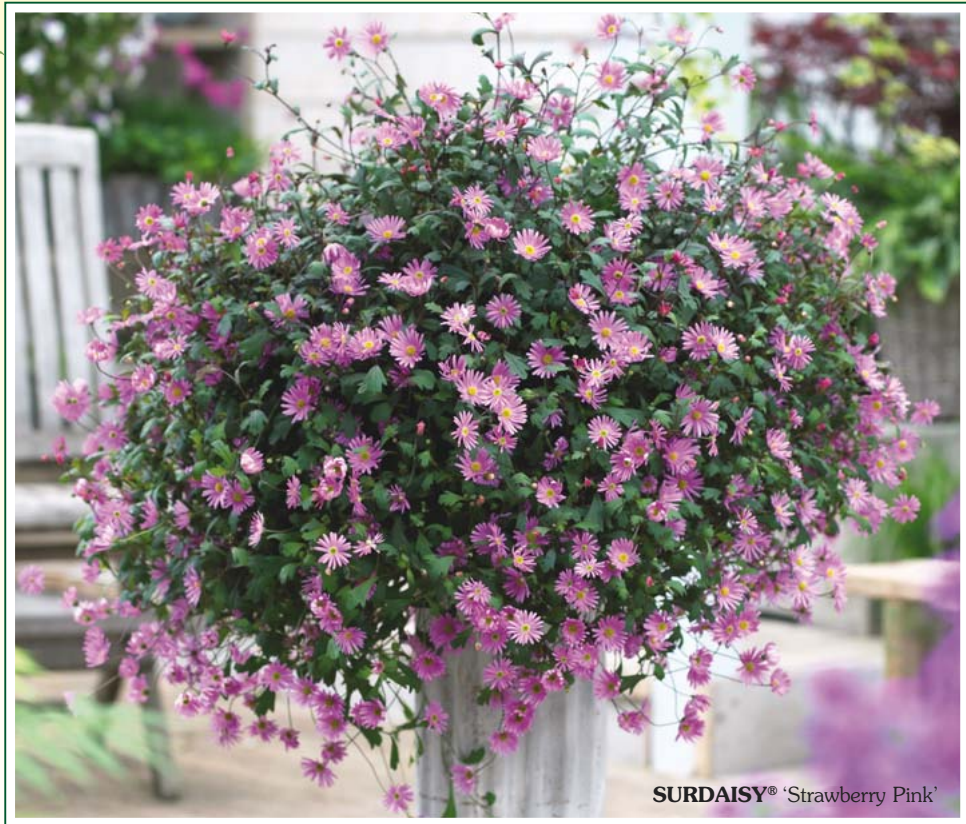
SURDAISY® 'Strawberry Pink'