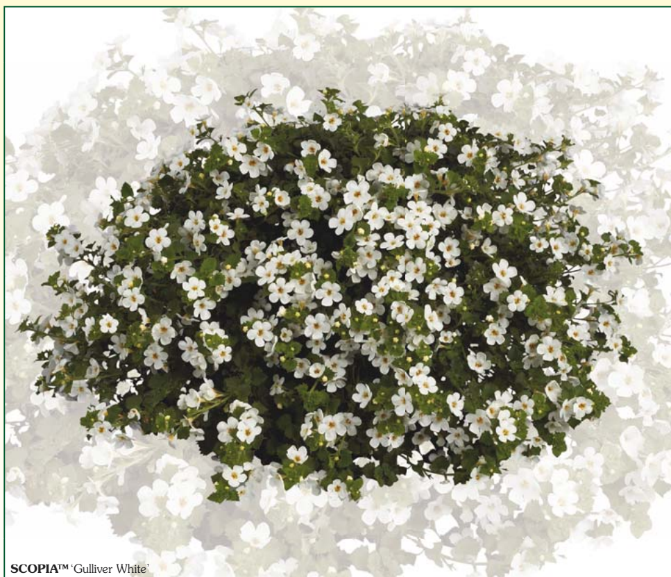
SCOPIA™ 'Gulliver White'