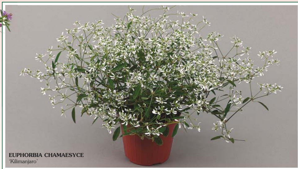
EUPHORBIA CHAMAESYCE 'Kilimanjaro'