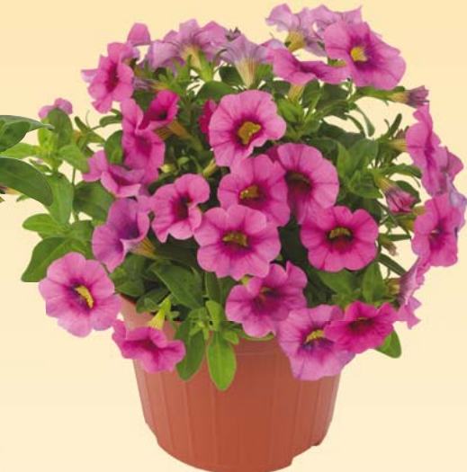
MILLE BACI® 'Rose'