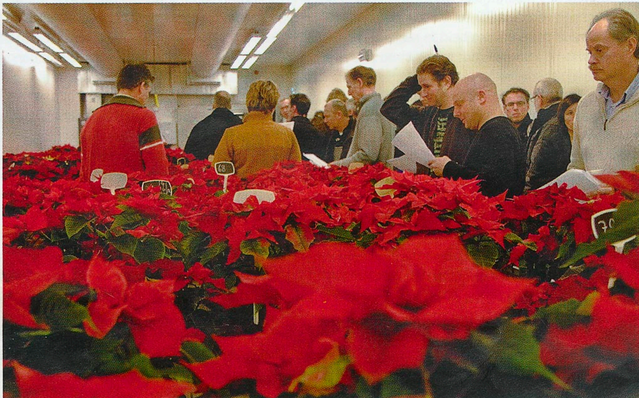
Telers en veredelaars bekijken de houdbaarheidsresultaten van de kwaliteitscompetitie poinsettia.