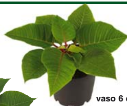
vaso 6 cm