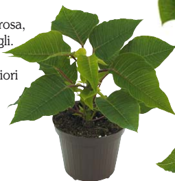
vaso 9 cm

Si trova in vasetti da 6 e 9 cm uniflora e 11 cm spuntati e consente di effettuare colture molto rapide senza particolari attrezzature.