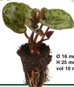
Ø 16 mm H 25 mm vol 10 ml

ECOPOT® 16 mm: Dimensioni 16 mm di diametro per 25 di altezza. Si producono ciclamini seminati, selezionati e riposizionati nella cassetta da 252 fori . Ideale per il trapianto meccanico.