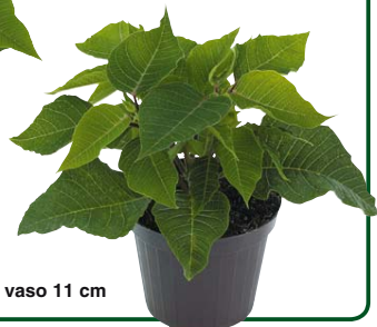
vaso 11 cm