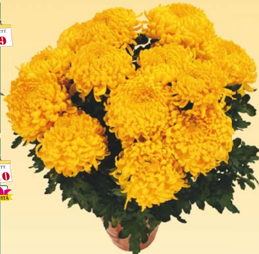
GLOBUS™ 'Jikila Jaune'