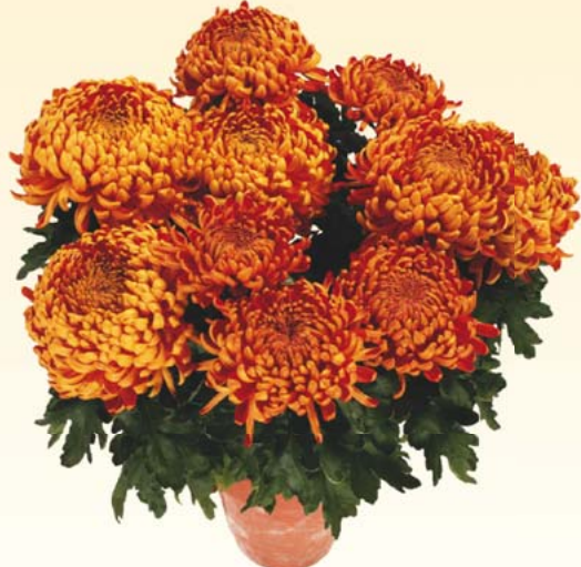
GLOBUS™ 'Jikila Cuivre'