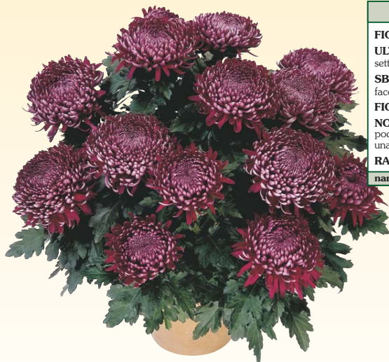
GLOBUS™ 'Tempo® Violet'