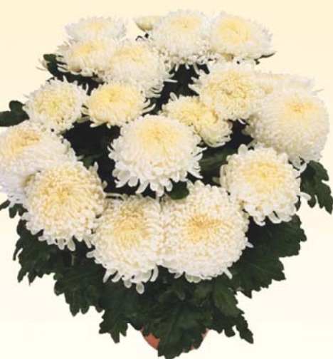
GLOBUS™ 'Aria Blanc'